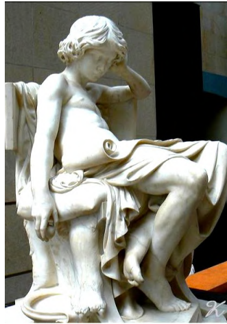
Charles Degeorge, La Jeunesse d'Aristote (1875), Paris, Musée d'Orsay